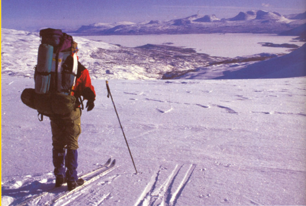
Udsigten over Torneträsk-søen på vej til Lappjordhytten.

For mange er Kungsleden i Sverige blevet løsningen, når fjeldskituren skal være lidt mere vild. Men hvad sker der, hvis man ændrer kursen 180 grader og i stedet går nordpå fra Abisko? Jo, man krydser hurtigt grænsen til Norge og kommer ind i et vidunderligt skiterræn, der burde lokke mange flere turister til. Fjeldene er måske ikke helt så spektakulære som på den svenske side, men der er rigelig med udfordring for selv erfarne skifolk. Her er scooterkørsel forbudt, terrænet er ikke befængt med store røde krydser, og de hyggelige hytter er sjældent overfyldte.