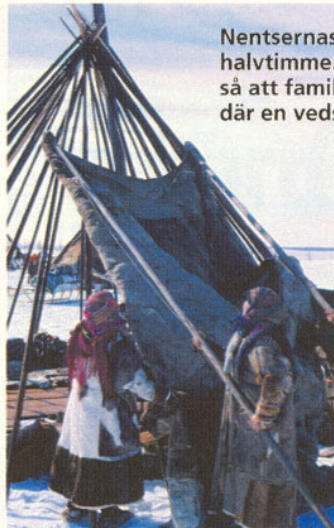
Nentsernas tält (tjum) reses på under en halvtimme. Både män och kvinnor hjälper till så att familjen snabbt kan komma in i tältet där en vedspis sörjer för en behaglig värme.